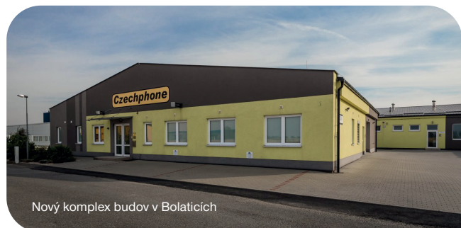
Nový komplex budov v Bolaticích

V současnosti firma představuje významného dodavatele v oblasti veškerých elektroinstalací, montáže a autorizovaného