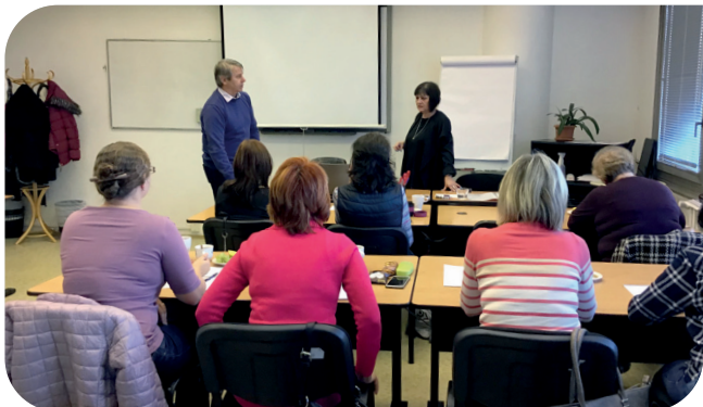
Zaměstnanci členských firem se mohou hlásit do více než dvou set vzdělávacích kurzů.

Krajská hospodářská komora MSK (KHK MSK) získala dotaci na nový projekt s názvem Vzdělávání zaměstnanců. Projekt je realizován s finanční podporou EU. Je financován Evropským sociálním fondem a státním rozpočtem ČR v rámci Operačního