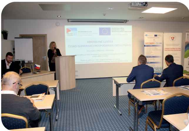
Jednou z aktivit projektu je pořádání workshopů.

Ostravský Infobod CZ-SK doplnil už fungující síť podobných center ve Zlíně a v Žilině. Poskytované informace se týkají například podnikatelského prostředí, legislativních podmínek, investic, dotací, daňové a pracovní právní problematiky. Infobod také pomůže například s vyhledáním dodavatelů a partnerů pro společné podnikání. Za dobu realizace projektu bylo poskytnuto poradenství stovkám organizací Moravskoslezského kraje. (ih)