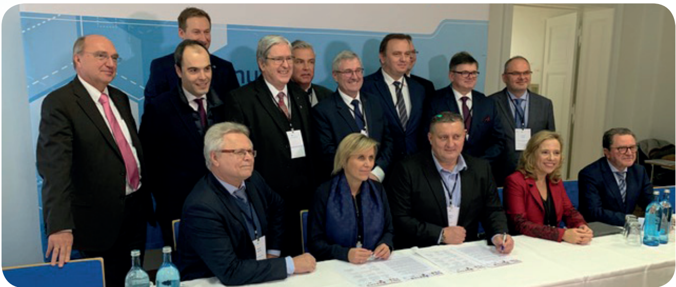
Představitelé 14 uhelných regionů v Evropě, včetně tří českých, podepsali v německém Görlitzu memorandum o úzké spolupráci při transformaci krajů spojené s postupným ukončením těžby uhlí.

Za období fungování programu RE:START se speciálně na tento program alokovalo do tří zmíněných krajů necelých pět miliard korun, z nichž šlo do Moravskoslezského kraje zhruba 2,73 miliardy korun. To znamená, že více než polovina. Peníze