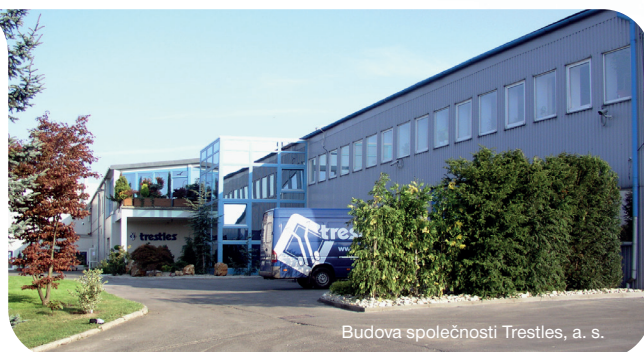
Budova společnosti Trestles, a. s.

Celkem 95 procent produkce firma exportuje. Mezi nejvýznamnější odběratele patří obchodní řetězce v zemích EU, především v Německu, Rakousku, Polsku, Francii, Španělsku, Dánsku, Velké Británii, dále v Nizozemsku, Chorvatsku, mimo EU pak ve Švýcarsku. Společnost patří k nejvýznamnějším subjektům na středo-