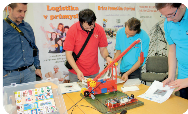
Soutěž T-PROFI má v dětech rozvíjet manuální zručnost a kreativitu.

První místo v soutěži získal tým společnosti OSTROJ, složený ze Střední školy technické v Opavě a ZŠ T. G. Masaryka Opava. Na druhé příčce se umístil tým BENEKOVterm se studenty Střední průmyslové školy a Obchodní akademie, Bruntál, a žáků Základní školy Bruntál. Třetí skončil tým LIFT COMPO-